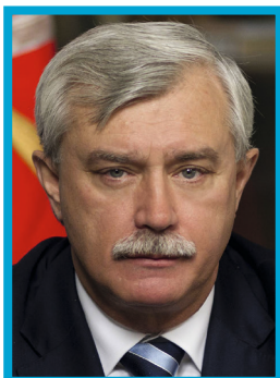
24.02.1953 Полтавченко Георгий Сергеевич